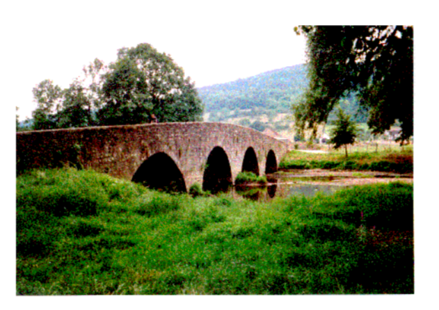
Pont de la RD427