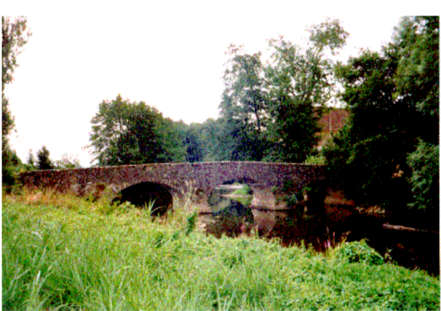
Pont de l'ancien moulin Rion