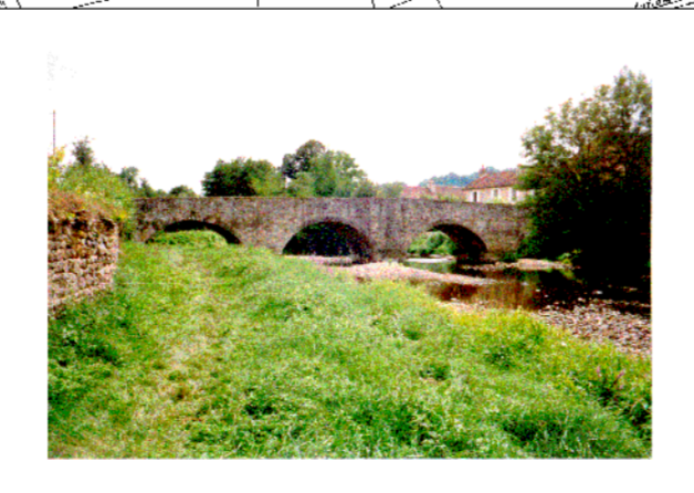
Pont de la RD142 - Sbv = 416,86 km 2 - P10 = 62 mm/jour - Q10 = 75 m 3 /s - Q100 = 150 m 3 /s