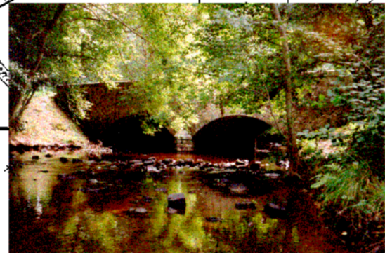
Pont de la RD55 Sbv = 80,56 km 3 P10 = 64 mm/jour Q10 = 21 m 3 /s Q100 = 42 m 3 /s