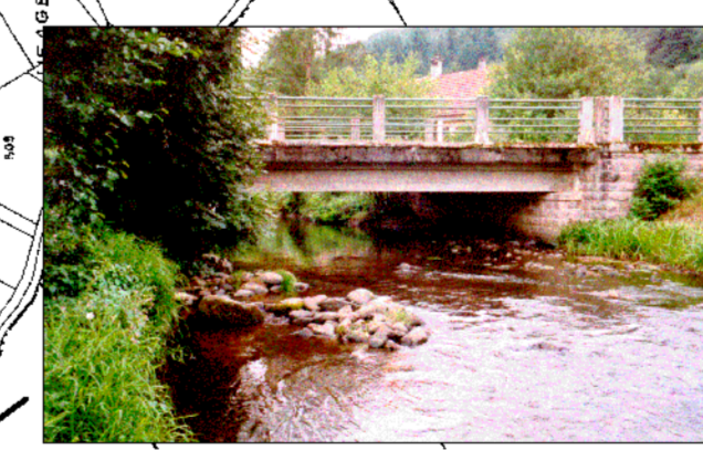
Pont de la RD355 au niveau de Trinquein. Refait en 1955, cet ouvrage semble n'avoir jamais été submergé depuis.