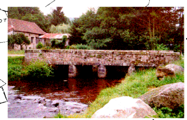
Pont de la route menant au Moingeois. Cet ouvrage semble n'avoir jamais été submergé depuis la réalisation du barrage de St-Agnan (1969). Sa capacité apparaît cependant insuffisante vis-à-vis d'un événement centennal.

Par ailleurs, sa structure en arche augmente considérablement les risques d'ombâcles.