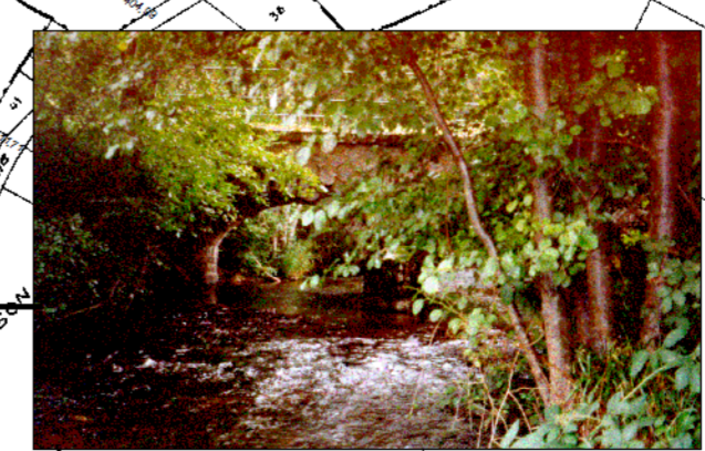
Pont de la route menant au lac de St-Agnan.

Par ailleurs, sa structure en arche augmente considérablement les risques d'ombâcles.