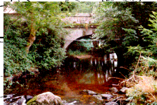
Pont de la RD355 au niveau du moulin Colas